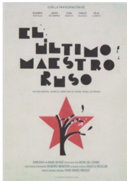
Affiche du film El último maestro ruso