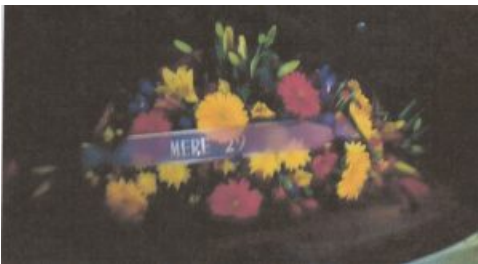
Penmarc'h, 8 mai 2019 : Gerbe de MERE29