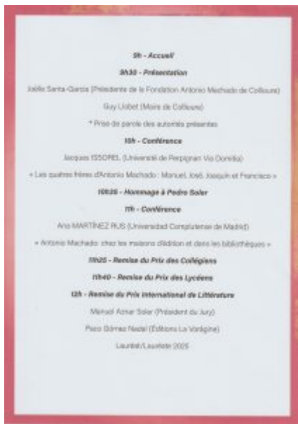
Journée ANTONIO MACHADO. Programme. Page 1