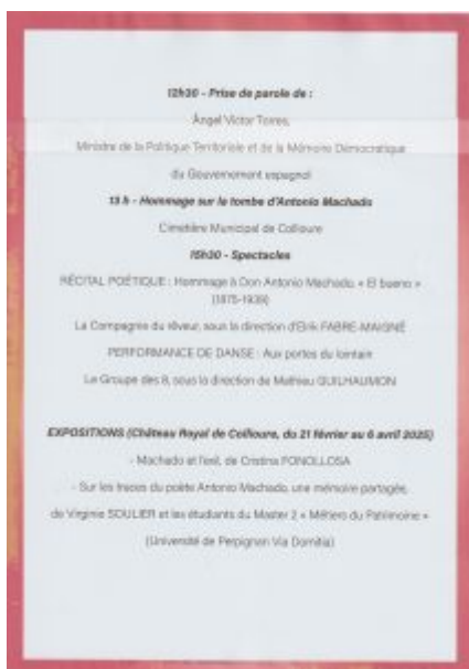
Journée ANTONIO MACHADO. Programme page 2